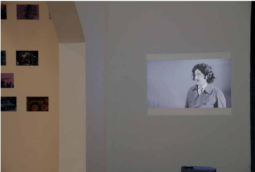
Installation als Tageslichtprojektion mit zwei Kopfhörern.