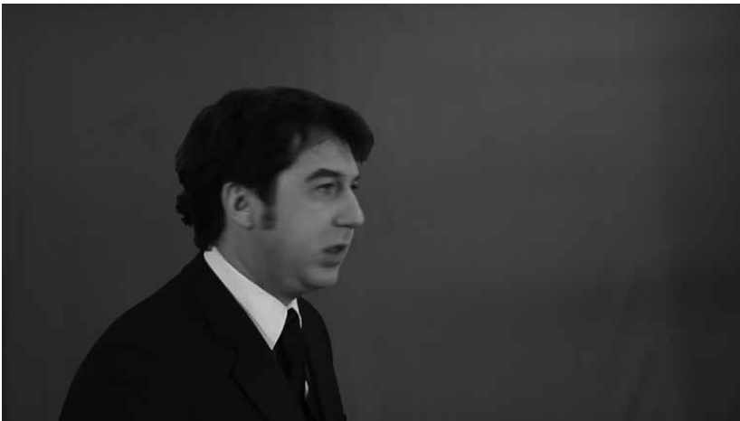
Beyers fiktiver Charakter "Goldenberg".

Bayer, der etwa um 1954 der österreichischen Autorenvereinigung „Wiener Gruppe“ gemeinsam mit H.C. Artmann, Ernst Jandl oder Friederike Mayröcker angehörte, las 1962 eine Passage aus diesem Buch. Die Originalaufnahme verleiht dem Darsteller im Video nun seine schalkhafte Stimme und lässt Fiktion, Geschichte und Geschichten miteinander verschmelzen.