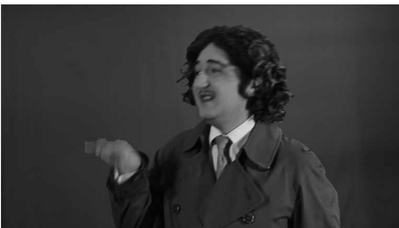
Beyers fiktiver Charakter "der vornehme, junge mann".